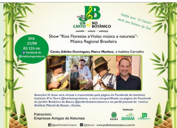
Figura 5: Chamada live Show “Rios Florestas e Violas: música e natureza”

NOME DA AÇÃO/PROJETO: “Rios Florestas e Violas: musica e natureza”