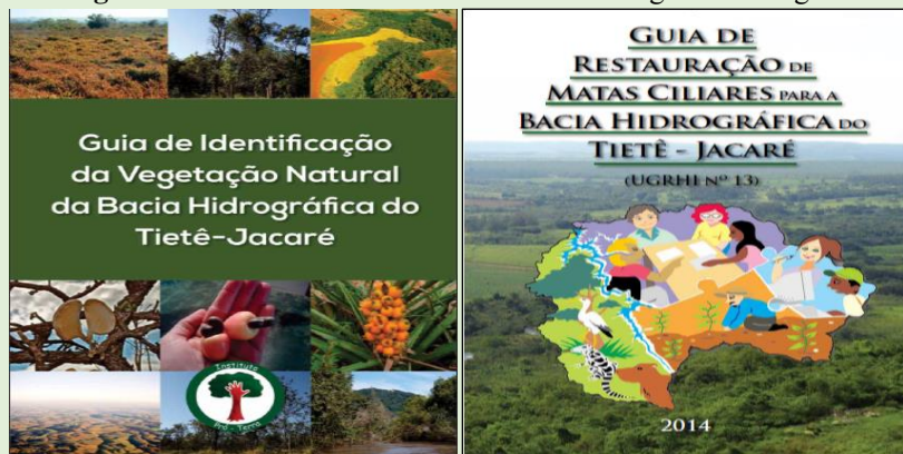
Figura 3 – Guias sobre a Bacia Hidrográfica Tietê-Jacaré

NOME DA AÇÃO/PROJETO: Acervo da Sala Verde Instituto Pró-Terra e publicações