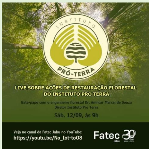
Figura 4: Chamada da Live sobre ações de restauração florestal do Instituto Pró-Terra

NOME DA AÇÃO/PROJETO: Live sobre ações de Restauração Florestal do Instituto Pró-Terra