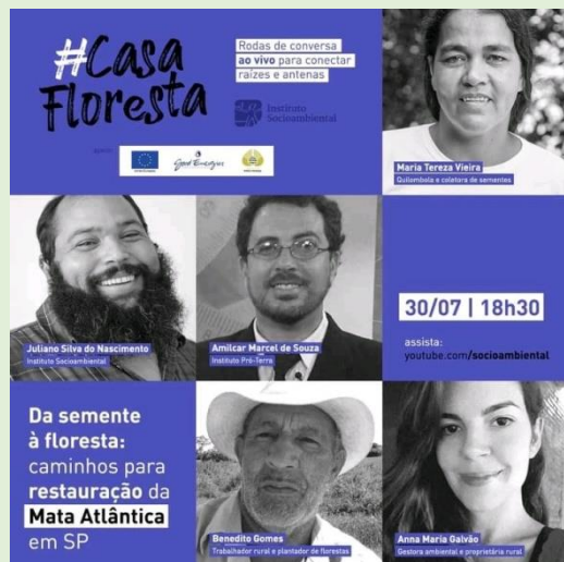
Figura 3: Chamada Live Da Semente á Floresta - caminhos para a Restauração da Mata Atlântica em SP

NOME DA AÇÃO/PROJETO: Live Da Semente á Floresta - caminhos para a Restauração da Mata Atlântica em SP