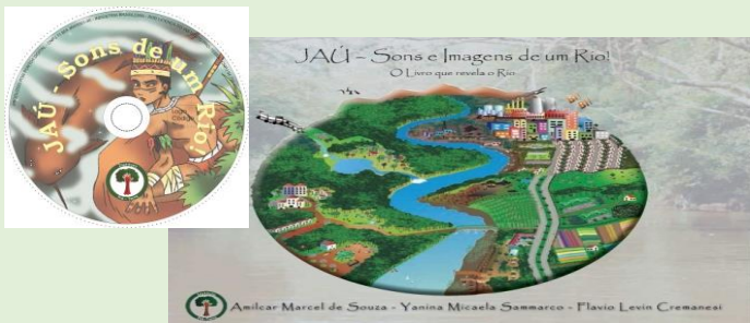
Figura 1 – Livro e CD musical “Jaú – Sons e Imagens de um Rio!”