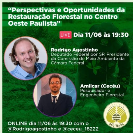
Figura 1 – Chamada para live “Perspectivas e Oportunidades da Restauração Florestal no Centro Oeste Paulista”.

NOME DA AÇÃO/PROJETO: Perspectivas e Oportunidades da Restauração Florestal no Centro Oeste Paulista