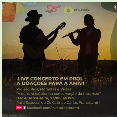
Figura 2 – Chamada Live Concerto em Prol a Doações para a AMAI.

NOME DA AÇÃO/PROJETO: Projeto Rios, Florestas e Violas.